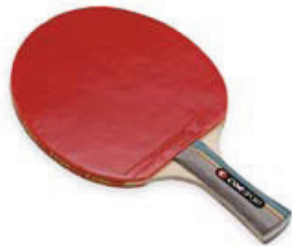
6414 RACCHETTA "PRO" telaio in legno a 5 strati, gomme traslucenti bicolori lisce omologate ITTF, con gomma piuma, manico sagomato composto *** 3 stelle