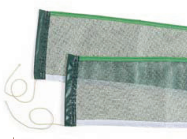
6434 RETE DI RICAMBIO IN NYLON completa di tiranti, adatta per art. 6438 e tavoli Cor Sport