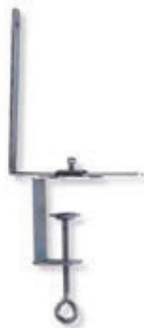
6432 SOSTEGNI PER RETE in metallo regolabili