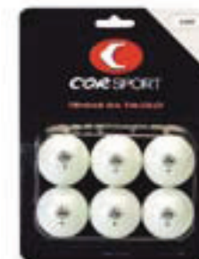
6450 PALLINA 1 STELLA bianca, senza saldatura confezione da 6 pezzi in blister