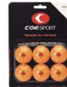
6452 PALLINA 1 STELLA arancio, senza saldatura confezione da 6 pezzi in blister