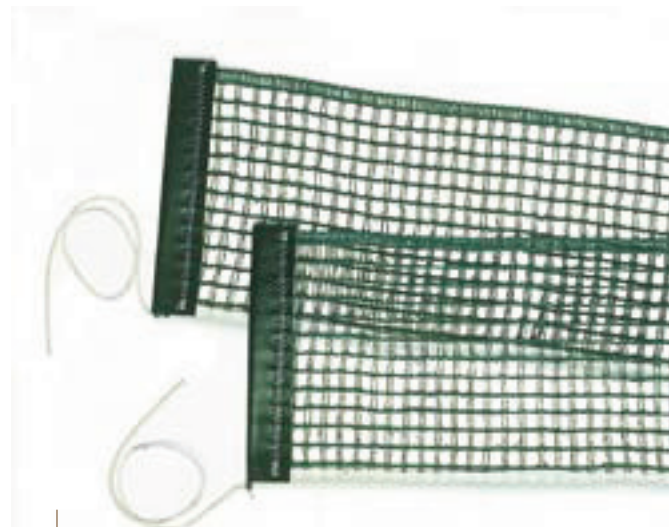
6435 RETE GARA COTONE/NYLON completa di tiranti, adatta per art. 6432