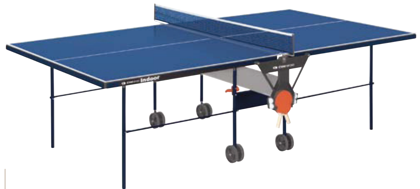
6472 TAVOLO DA INTERNO Piano in agglomerato ad alta intensità da 16 mm di spessore, bordi perimetrali in profilato metallico, laccato blu, richiudibile, dotato di bloccaggi di sicurezza, telaio in acciaio verniciato, con 4 ruote di cui 2 girevoli, completo di supporti e rete. misure aperto: mm 2740x1525x760 - misure chiuso: mm 1525x1875x665 - misure imballo: mm 1630x1410x95 peso kg 78