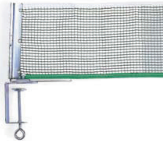
6436 SOSTEGNI IN METALLO PER RETE regolabili, completi di rete in nylon