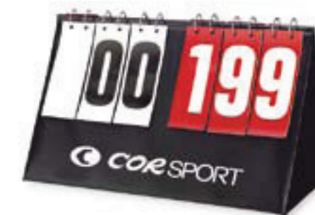
6441 SEGNA PUNTI PIEGHEVOLE punteggio da 00 a 99 e 9 set per squadra