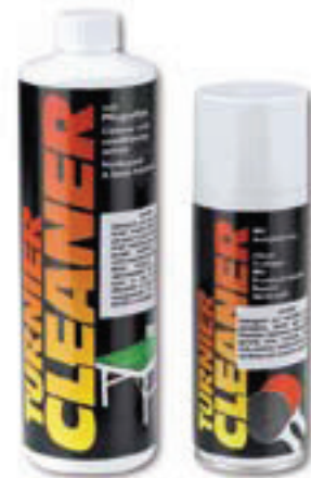
6491 DETERGENTE PER TAVOLI DA PING-PONG flacone ml 500 6492 DETERGENTE PER RACCHETTE DA PING-PONG flacone ml 200