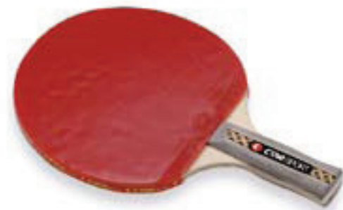
6416 RACCHETTA "MATCH" telaio in legno a 5 strati, gomme traslucenti bicolori lisce omologate ITTF, con gomma piuma, manico sagomato composto *** 3 stelle