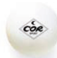
6456 PALLINA 3 STELLE bianche - confezione da 3 pezzi