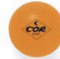
6458 PALLINA 3 STELLE arancio - confezione da 3 pezzi