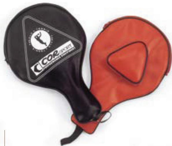
6430 CUSTODIA PER RACCHETTE in similpelle con portapalline colori assortiti