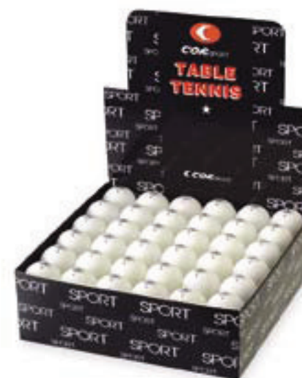
6460 PALLINA 1 STELLA bianca, senza saldatura confezione da 72 pezzi